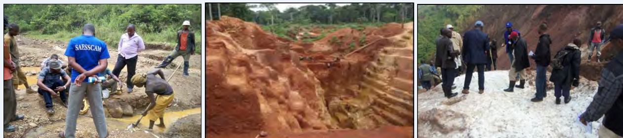
Tab.3. Statistiques de Production des sites qualifiés et/ou validés